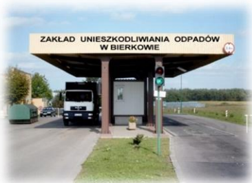
Zakład Unieszkodliwiania Odpadów w Bierkowie