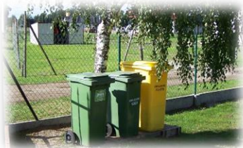
Budowa punktów selektywnej zbiórki odpadów w Gminie Liniewo i Gminie Lipusz

Usuwanie wyrobów zawierających azbest w 76 gminach woj.pomorskiego