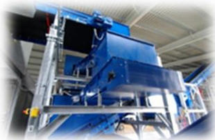
Zakład Zagospodarowania Odpadów w Chlewnicy, ELWOZ Sp. z o.o.