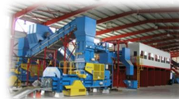
Zakład Utylizacji Odpadów Komunalnych „Stary Las” Sp. o.o. i wiele innych...